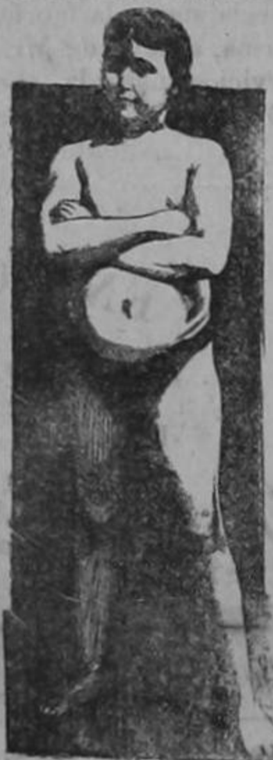
EDAD 11 AÑOS

La transformación maravillosa de un sér endeble y raquítico en un adolescente fuerte, robusto y sano, como lo demuestra su atlética figura, fué obra realizada por la